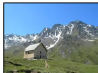
Chapelle de Clausis