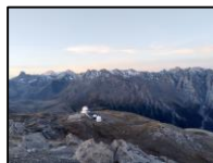
Observatoire de Château Renard

Passionnés, curieux en quête de merveilleux, l'équipe de l'observatoire vous accueille à 2936m pour une nuit cosmique la tête dans les étoiles !