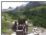
Mine de cuivre