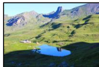
Refuge et lac de la Blanche

De la cabane de la Lavaite, en 15 minutes d'une balade familiale très facile, découvrez les vestiges de la mine de cuivre en parcourant le sentier d'interprétation libre et gratuit.